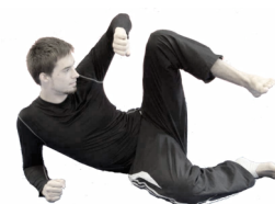
Defensive ground position – kaitseasend maast